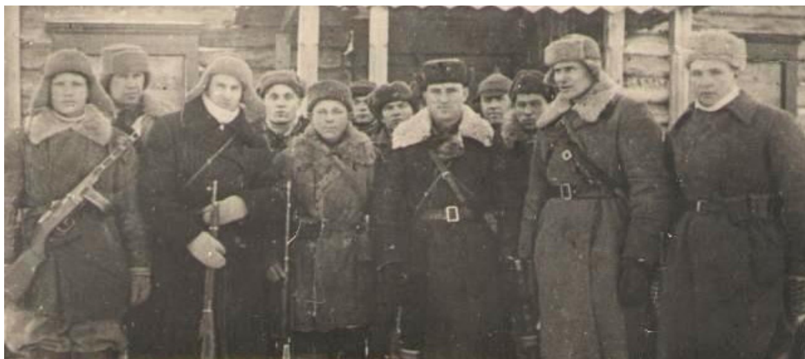
Партизаны Россонской партизанской бригады им. И.В. Сталина

пустить проникновения карателей в Россонско-Освейскую партизанскую зону.